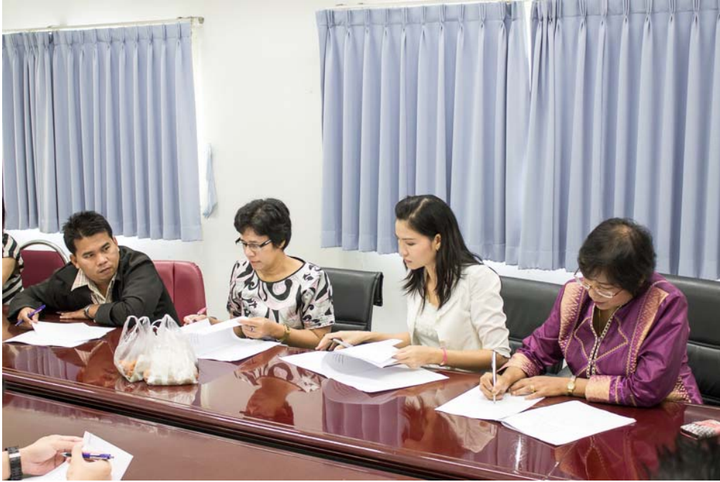
กลุ่มกล้วยแขก