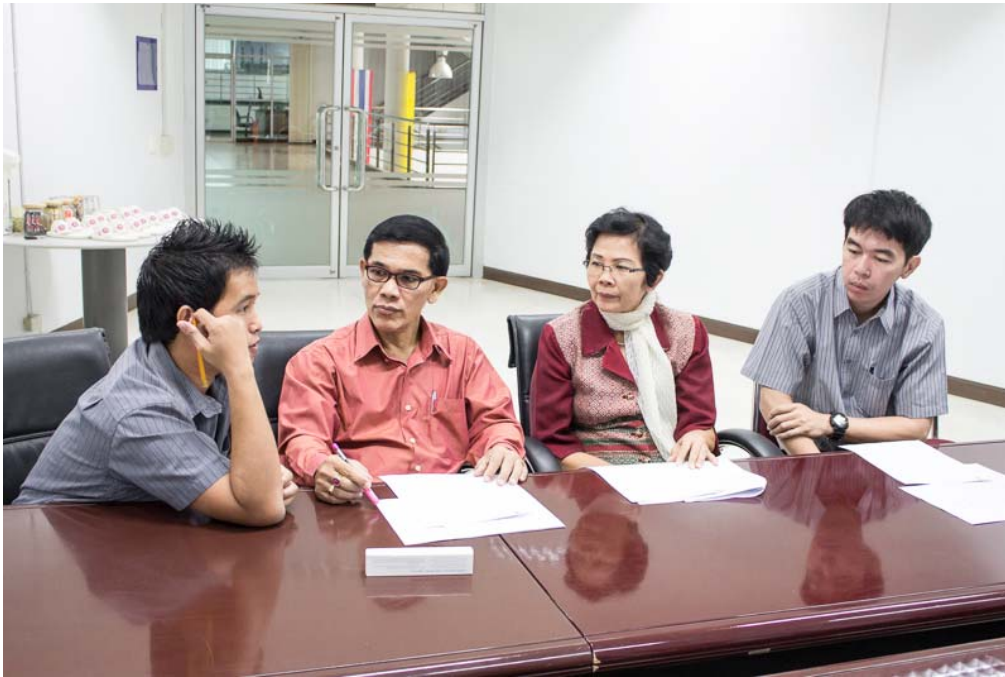
กลุ่มยาสีฟัน

วิทยากรได้จัดกลุ่มแบ่งกลุ่มออกเป็น 3 กลุ่ม ได้แก่ กลุ่มกล้วยแขก กลุ่มยาสีฟัน และกลุ่มน้ำเปล่า และอธิบาย กระบวนการบริหารจัดการความเสี่ยงให้กับทุกกลุ่ม โดยให้ทุกกลุ่มเป็นพ่อค้าวิเคราะห์ความเสี่ยงเกี่ยวกับการ ขายสินค้าของตนเอง